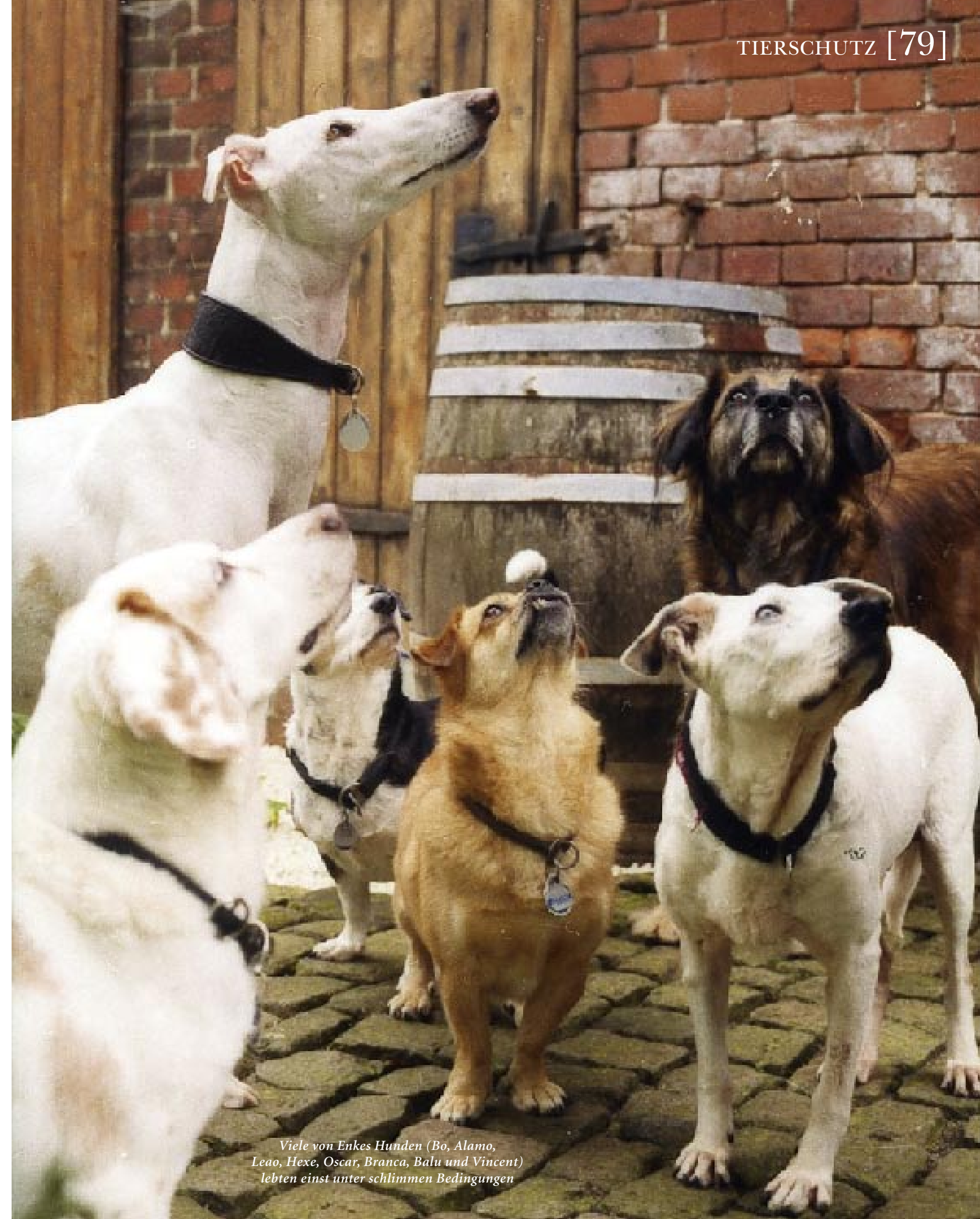
Viele von Enkes Hunden (Bo, Alamo, Leao, Hexe, Oscar, Branca, Balu und Vincent) lebten einst unter schlimmen Bedingungen