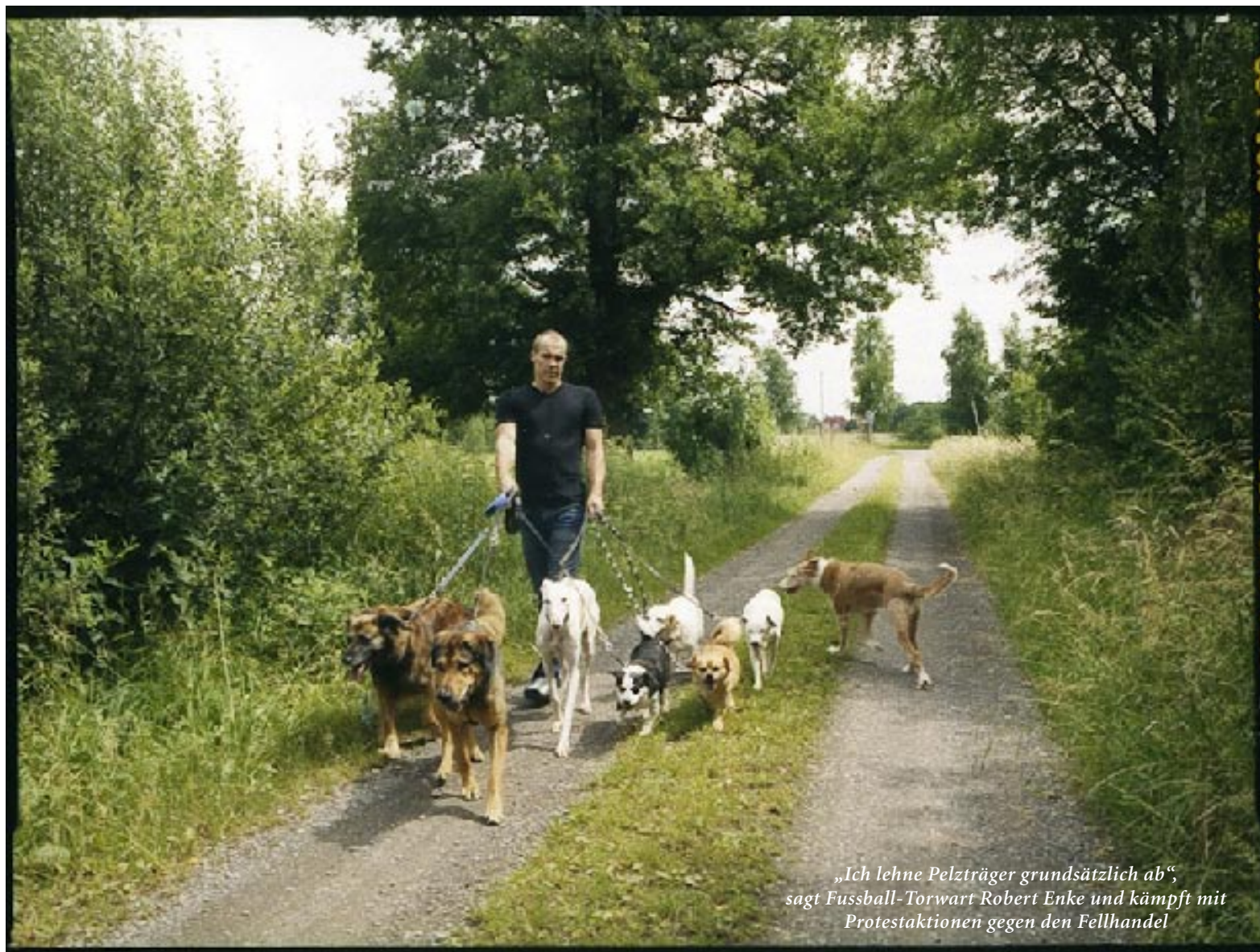
„Ich lehne Pelzträger grundsätzlich ab“, sagt Fußball-Torwart Robert Enke und kämpft mit Protestaktionen gegen den Fellhandel

ein Zuhause“ unvermittelbar erschien. „Ein behinderter Jagdhund mit dreieinhalb Beinen“, wie Enke bitter bemerkt, „wahrscheinlich ein Verkehrsunfall.“ Die Erziehung des Hundes war ungewohnt, die Enkes unerfahren. „Da haben wir sicher Fehler gemacht“, gibt er mit sportlichem Sinn für Kritik zu. In der Mietwohnung wurde es gemütlich, man könnte auch sagen: eng.